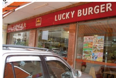
McDonalds finns inte (ännu) - men däremot lokala Lucky Burger. Andra lokala snabbmatskopior är Burger Kong och Pizza Hot.