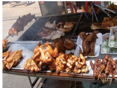
Grillade saker är goda och billiga i gatustånden.