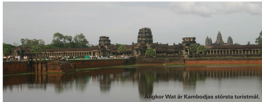
Angkor Wat är Kambodjas största turistmål.