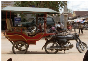
En vanlig taxi i Siem Reap.

Det fina med att dricka här är att fem procent av intäkterna till att finansiera ett barnhem – då