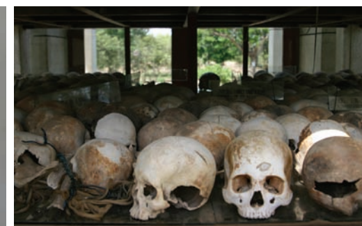
Rader av dödsallar möter dig på Killing Fields.

Alla gravar är inte uppgrävda men på marken syns kläder och benrester från offren.