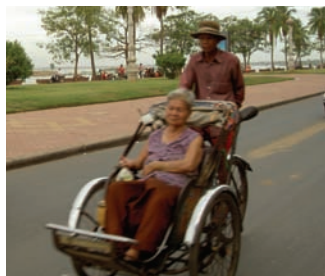
Cyclo - klassisk cykeltaxi.

med plats för upp till fyra personer, kallas ibland motodup .