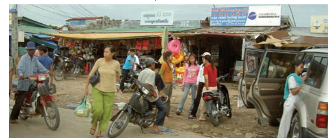
På marknaden i Sihanoukville.