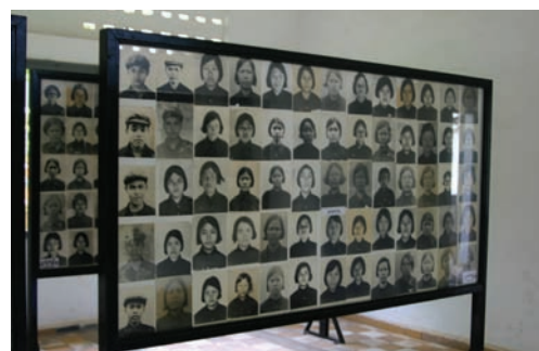
Bilder på offer i tortyrcentralen S-21.