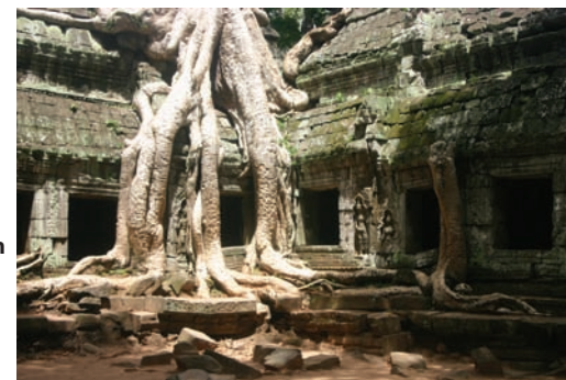
Ta Prohm – träd och rötter växer bland templen.

Huvudattraktionen verkar annars vara möjligheten att få fina bilder av Angkor Wat i solnedgång. Tyvärr är du inte ensam om att upptäcka det.