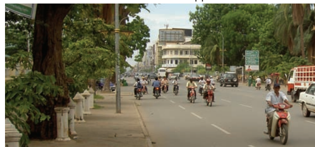
Fler mopeder än bilar kör på Phnom Penhs gator.

Pruta rejält då 99% av allt som säljs här är piratkopierat.