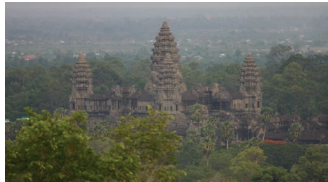
Ute i djungeln ligger världsarvsklassade Angkor Wat.