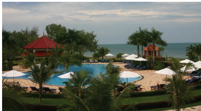
Sihanoukville är både turistort och hamnstad.

När kungariket återinfördes 1993 togs det gamla namnet Si-