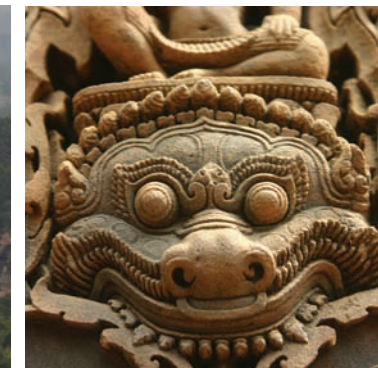
Detalj vid "kvinnornas citadell".

ger en bit ifrån de andra tempelen. Något man inte bör missa då några av de absolut vackraste och bäst bevarade bilder uthuggna i röd sandsten finns här.