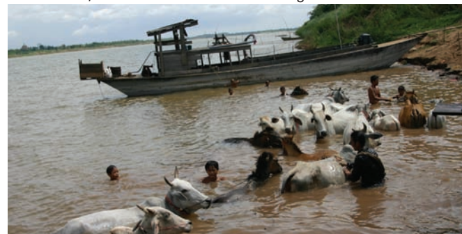
På flodutflykt längs Mekong möter du det äkta Kambodja.

Förr en kinesisk kyrkogård. När röda khmerna tog över blev det en massgrav för över 17.000 män, kvinnor och barn.